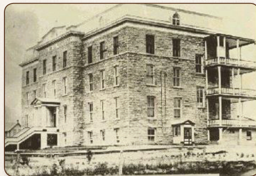
L'Hôpital de Haileybury a été complètement détruit par l'incendie.