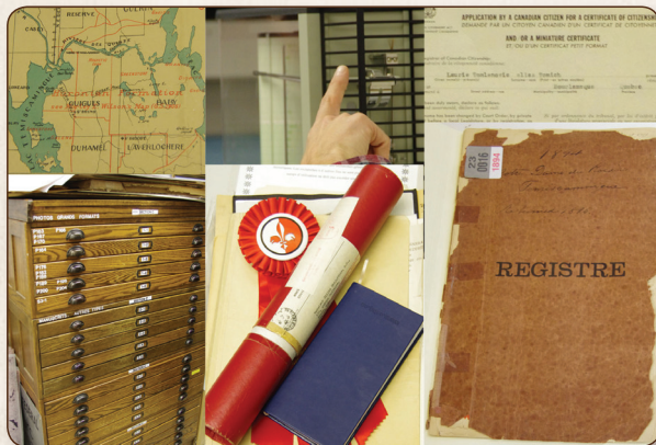
Visite du centre d'archives

En après-midi le personnel de Bibliothèque et Archives nationales du Québec (BAnQ) a traité de la recherche et des services en généalogie, des ressources du Portail de BAnQ et du potentiel généalogique des archives personnelles et familiales. La visite guidée du Centre d'archives de l'Abitibi-Témiscamingue et du Nord-du-Québec fut grandement appréciée.