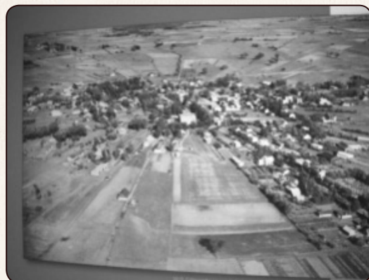
Charlesbourg en 1937

Au centre se retrouve le trait-carré, terrain de 5 arpents de long (800 pieds) par 5 arpents de large (800 pieds) pour un total de 25 arpents que les Jésuites font défricher sur lequel sera érigé l'église, le presbytère et le cimetière, le reste servira d'espace commun pour le pâturage des bêtes. Une rue faisant le pourtour sera nommée Trait-Quarré. L'habitation du Seigneur n'en faisait pas partie puisque son lot était plus au sud.