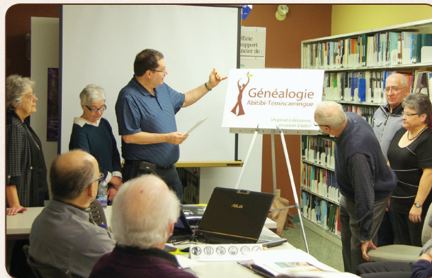
Le dévoilement de la nouvelle identité visuelle